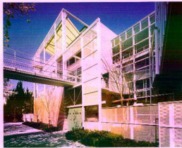
一産学官研究交流棟落成